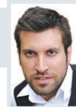
Επιμέλεια: Γιάννης Νιώρας