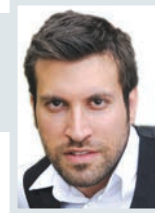
Επιμέλεια: Γιάννης Νιώρας